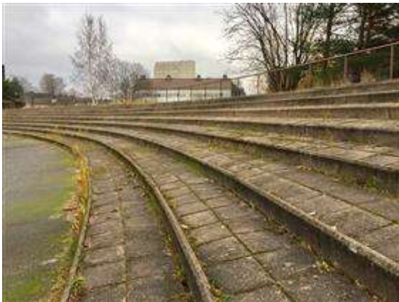
Kuvateksti: Betonilaatoilla pinnoitettu avokatsomo. Kuvallaji: yleiskuva Kuvausaika: 2.11.2021