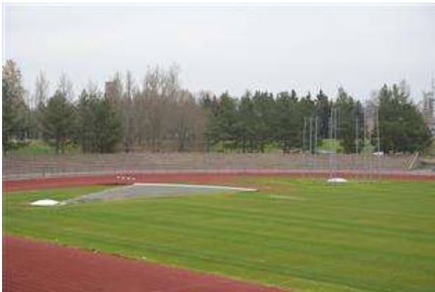
Kuvateksti: Kenttää rajaava avokatsomo. Kuvallaji: yleiskuva Kuvausaika: 2.11.2021