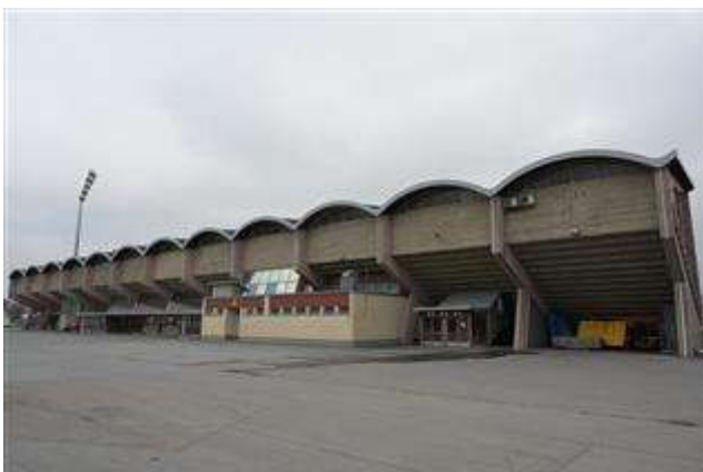
Kuvateksti: Matala laajennusosa liittyy muotokieleltään viereiseen huoltorakennukseen. Kuvalaji: yleiskuva Kuvausaika: 2.11.2021