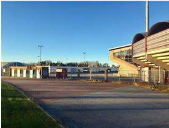
eteläinen päätykatsomo. Kuvallaji: yleiskuva Kuvausaika: 8.11.2021