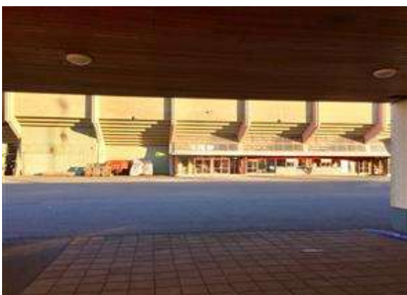
Kuvateksti: Näkymä huoltorakennuksen porttikäytävästä katsomon sisäänkäynnille. Kuvalaji: yleiskuva Kuvausaika: 8.11.2021