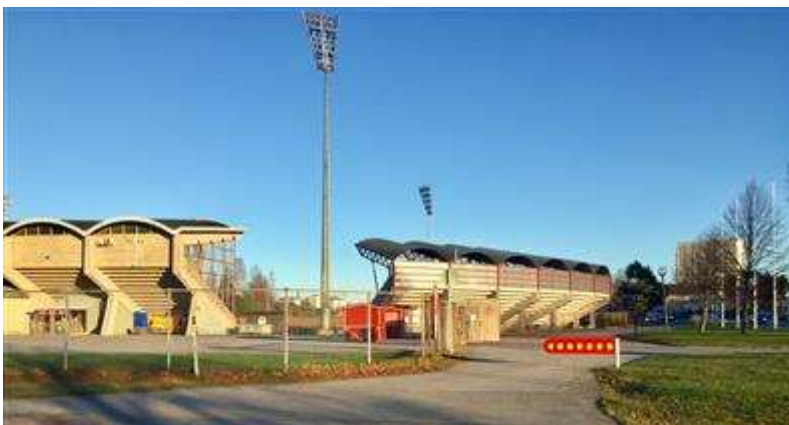
Kuvateksti: Pääkatsomo ja eteläinen sivukatsomo. Kualaji: yleiskuva Kuvausaika: 8.11.2021