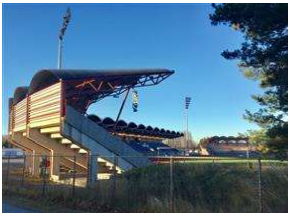
Kuvausaika: 8.11.2021