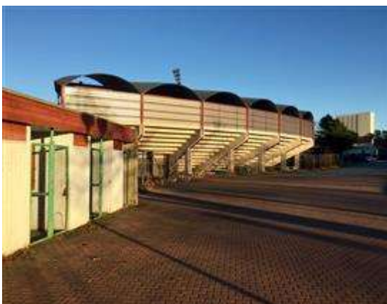
Kuvateksti: Lipunmyyntikopit ja eteläinen sivukatsomo. Kualaji: yleiskuva Kuvausaika: 8.11.2021